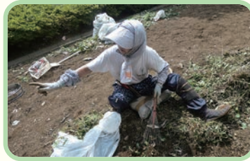
道具を使いながら効率的に作業します。

毎日規則正しい時間に仲間と顔を合わせ、助け合い協力をしながら作業できる上、報酬までいただき、その結果困っているお客さんに心から喜んでいただき感謝されることです。