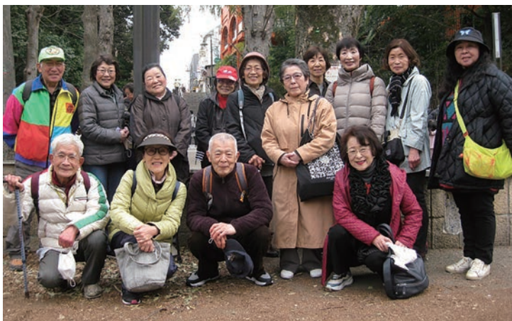
ほんの4ヶ月前ですが、、今年の春は寒かったですね。