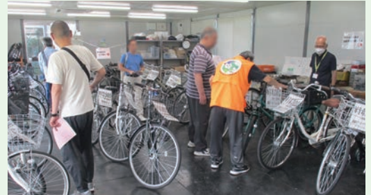
販売直前にお気に入りの自転車を探しています。