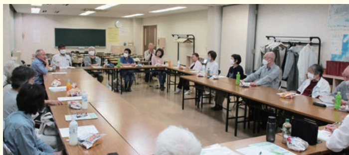
会員懇談会は年2回(6月・11月)実施しています。