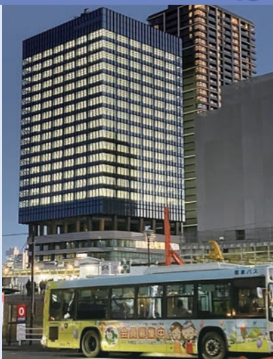
「ナカノサウステラ」と当センターのラッピングバス。