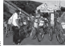
リサイクル自転車の販売