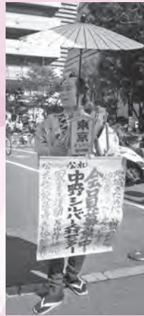
中野にぎわい フェスタ2018