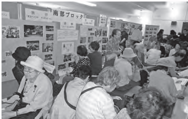
同時開催「地域班・ブロック活動紹介」

会場は500名(区民260名・会員240名)の満員でした。お越し下さった皆様に厚く御礼申し上げます。(事務局)