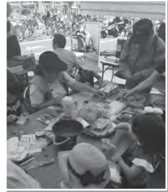
江古田班中山会員による「伝承遊び」クラフトテープでコマ作り